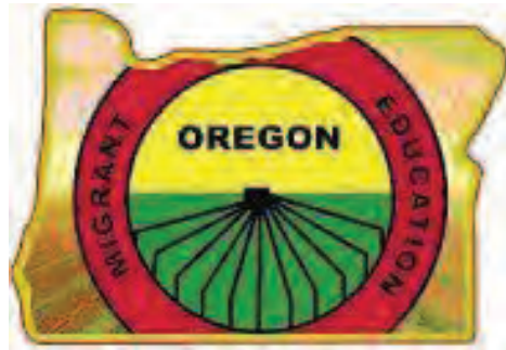
Migrant Education Program 541-461-8382

The Lane County Bilingual Directory of Services was produced and supported by the Migrant Education Program (MEP) of Lane ESD, City of Eugene Human Rights & Neighborhood Involvement , and the Integration Network for Immigrants of Lane County . It provides families and individuals with information in English and Spanish about services available in Lane County. Indicated by each agency /program is whether they have staff who speak Spanish.