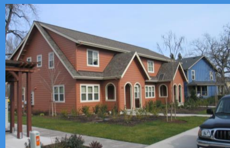
Tríplex y Cuádruplex