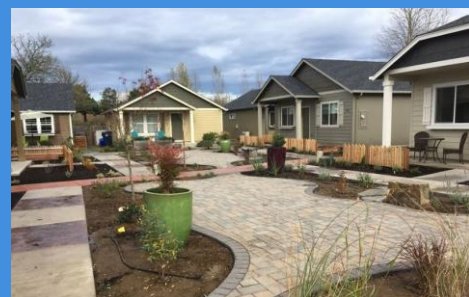
Grupos de cabañas